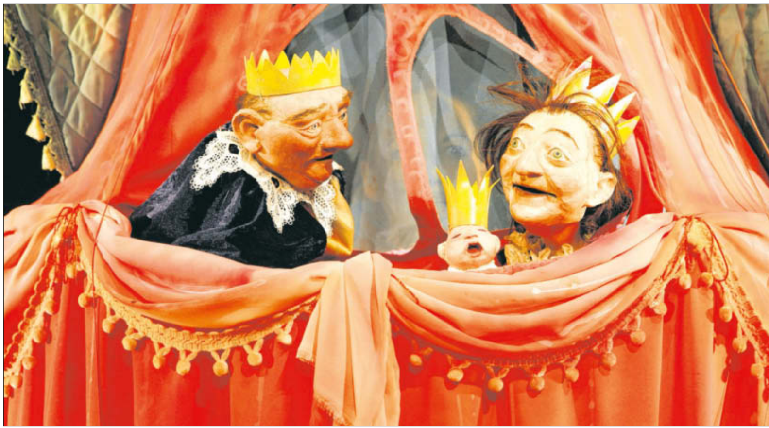
Das Puppenspiel „Dornröschen oder Warte mal!“ kommt am Sonnabend in der Kulturkirche St. Jakobi wieder auf die Bühne.

RIBNITZ-DAMGARTEN AUSSTELLUNGEN» Ostsee-schmuck-Schaumanufaktur, An der Mühle 30: 9.30-18.00 Größte Bernstein-schmuckausstellung Europas, Schmuckherstellung zum Anfassen